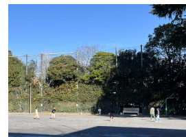
外遊び 体育館が使えないときは、校庭で遊ぶこともあります