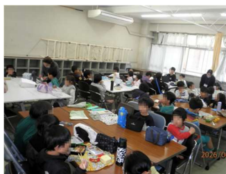
昼食 皆で食べるとおいしいね