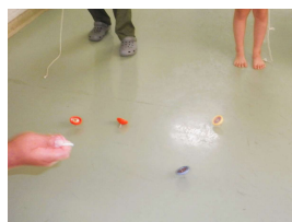
廊下を使ってコマ遊び