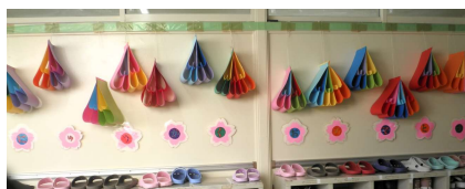
新入生をお出迎え