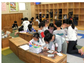
キッズルームで 新入生も在校生も、まだ緊張してる？