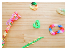
シリコンゴムで作品作り