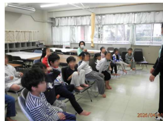
4/1 新1年生 オリエンテーション 自己紹介 キッズのルールの説明 静かにお話を聞けました