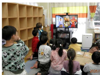
横浜市消防局の防災教室 動画を鑑賞しました