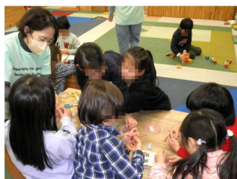
軟質カードケースと、 テープを使って、シャ カシャカ音のなる、か わいいキーホルダー 作りが子どもたちに 大人気です