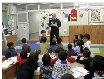
節分に関する話を静かに 聞いてます