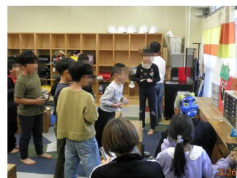
鬼の口に豆(紙玉)を入 れるゲームで盛り上がり ました