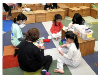
毛糸を使った制作