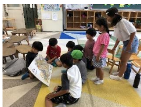
子どもたち自ら 紙芝居