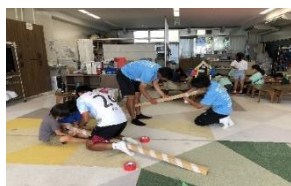
YSCCサッカー教室 (8/21(水)実施) 選手と一緒に御神輿作り

ゲームのルールを子どもたちで決めてお店屋さん・お客さんを交代して楽しみました！！ お祭りのフィナーレには御神輿を担ぎ、かき氷も楽しみました！！