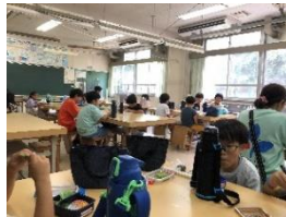
なかよく お弁当の時間