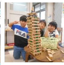
積み木も 協力して高い塔