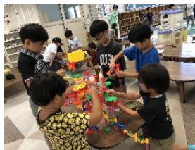
ビー玉転がし 共同作業